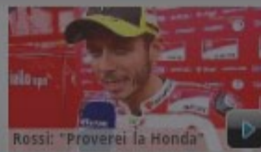
Rossi: "Proverei la Honda"