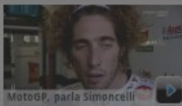
MotoGP, parla Simoncelli