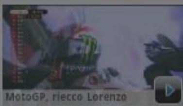
MotoGP, rievoca Lorenzo